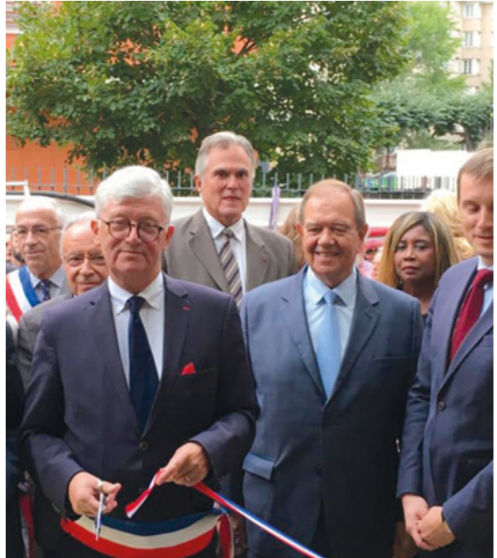
Inauguration de Cresco le 6 septembre 2019.