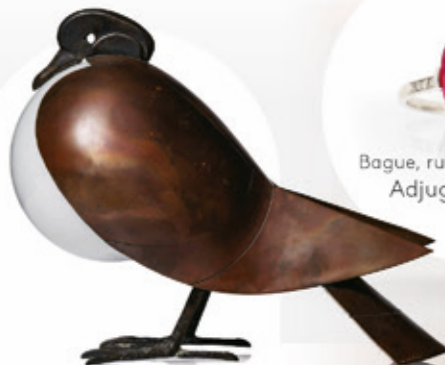
F.X. LALANNE. Lampe oiseau Adjugé 41 000 €