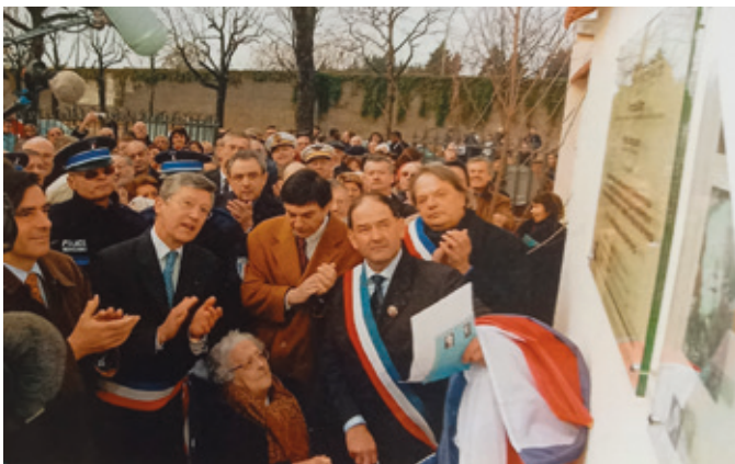
Inauguration du groupe scolaire Émilie et Germaine Tillion.

Au service de l'école et de l'enfance , en témoignent la construction du Groupe scolaire Émilie et Germaine Tillion ou la reconstruction du collège Offenbach, la création de la ludothèque, l'English School ou la mise en place de la restauration scolaire. Au service des familles et de leur bien-être , avec la construction de plus de 1000 logements, de crèches, du centre de soins, de la rénovation de l'HIA Begin. Au service de la solidarité intergénérationnelle , avec la construction de deux maisons de retraite et de la Maison de la famille.