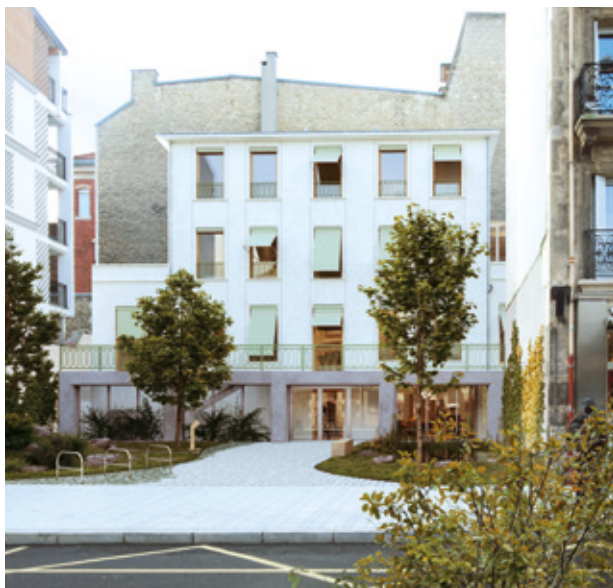
Perspective de la future Maison de santé

Bien que les entreprises mobilisées aient été particulièrement sensibilisées pour limiter l'impact des travaux, quelques perturbations sont à prévoir, telles qu'une circulation ponctuellement modifiée lors de certaines opérations spécifiques ou encore l'occupation partielle de l'espace public du fait de la présence d'engins aux abords du chantier. À noter que l'arrêt de bus situé à proximité immédiate du site est temporairement supprimé pendant la durée du chantier. Pour le bon déroulement de ces travaux,