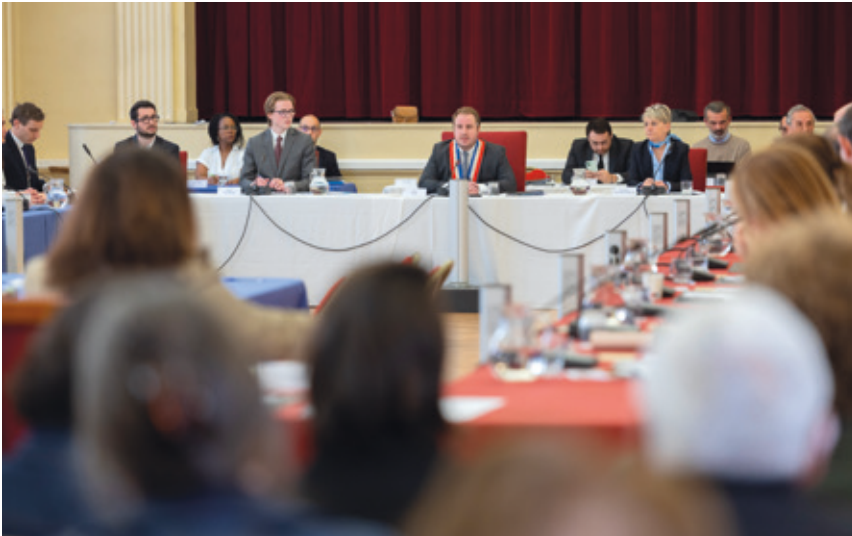
Séance d'installation du Conseil municipal le 21 mars dernier

“ Merci à toutes et tous pour ce soutien, cette mobilisation et cette confiance renouvelée. Cette victoire est celle d'une équipe engagée, d'un bilan solide et d'un projet clair pour l'avenir de Saint-Mandé. ”