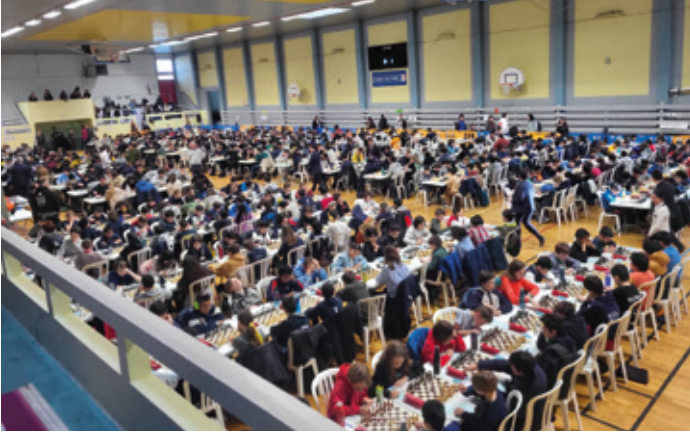
960 participants lors du championnat d'échecs d'Île-de-France.