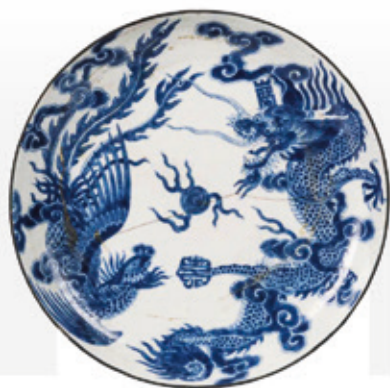
VIETNAM, XVIII e . Assiette bleu de Hue Adjugé 27 000 €

Les jeudis 16 et 30 avril, 7 et 21 mai, à SAINT-MANDÉ